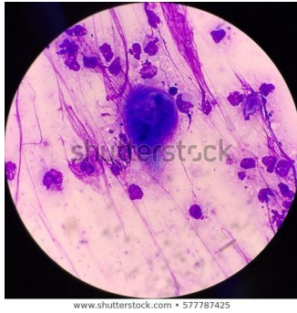
Gb. Hasil pemeriksaan laboratorium dengan pengecatan Giemsa