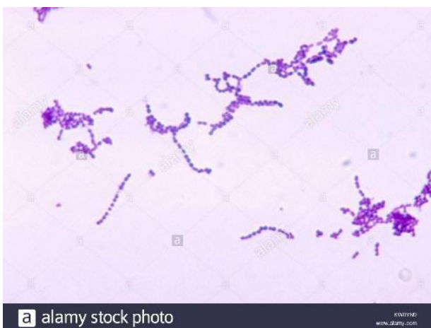
Gb. Hasil pemeriksaan laboratorium dengan pengecatan Gram