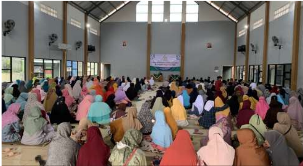
Gambar 2. Peserta pengajian ahad wage