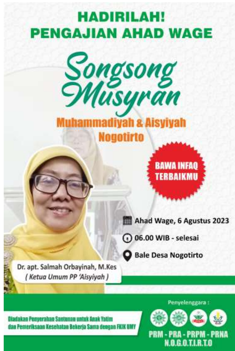
Gambar 1. Liflet kegiatan pengajian dan info pemeriksaan kesehatan

Telah dilaksanakan pengabdian masyarakat berupa pemeriksaan kesehatan Posandu Lansia Setaman pada tanggal 6 Agustus 2023, diikuti oleh 24 pasien. Dokumentasi kegiatan sebagai berikut :