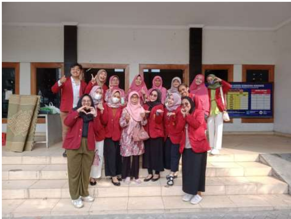
Gambar 5. Tim Kesehatan FKIK UMY foto Bersama ibu-ibu Aisyiyah Nogotirto se usai acara Posyandu Lansia