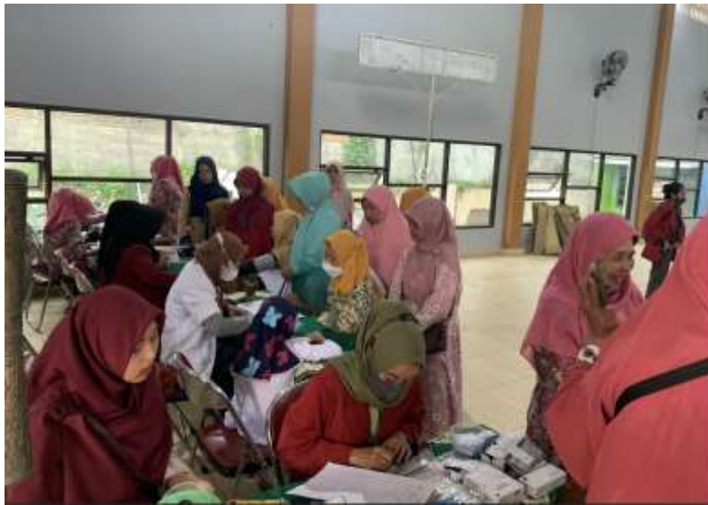
Gambar 3. Pendaftaran pasien, dilanjutkan pemeriksaan tekanan darah dan BB pasien